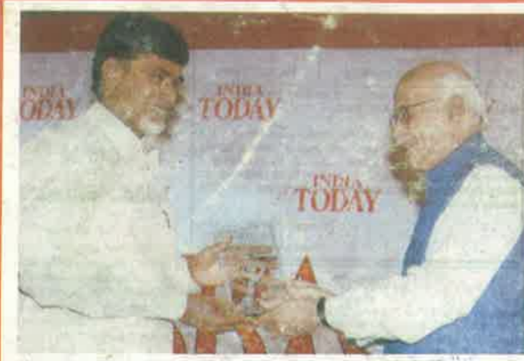
'ఇండియా టుడే' వారి ప్రతిష్టాత్మక 'ఫాస్టెస్ మూవర్' అవార్డును ఉప ప్రధాని అచ్చాన్ గారు చేతులమీదుగా అందుకుంటున్న ముఖ్యమంత్రి నారా చంద్రబాబునాయుడు